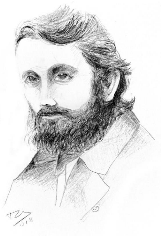
Philippe Cousteau Tolón-1940 Lisboa-1979

En defensa del legado y la memoria Cousteau